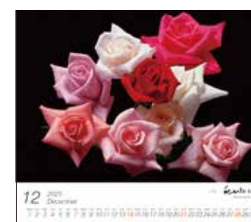
「バラ」(神奈川県平塚市)