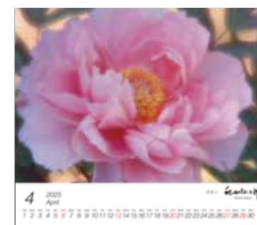
「ボタン」(福島県須賀川市)