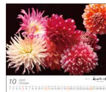
「ダリア」(東京都町田市)