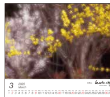
「花見山」(福島県福島市)