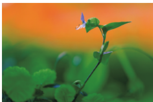
特選「ティンカーベルに出逢った夏」 清水清一（長野県）